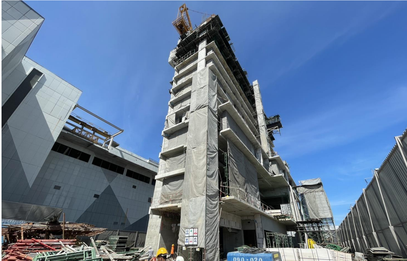
รูปที่ 1.3 สภาพโครงการในปัจจุบัน