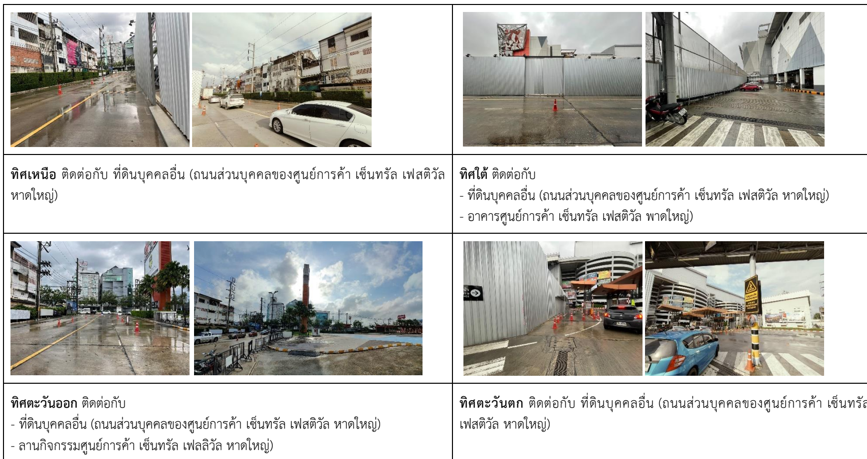
รูปที่ 1.2 แสดงการใช้ประโยชน์บริเวณพื้นที่โครงการและพื้นที่ใกล้เคียง